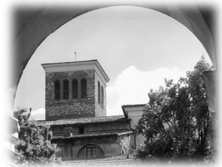
Figure's caption (calibri italic 10, under figure)